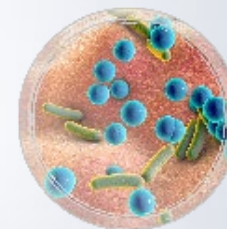
MICROBIOTE ÉQUILIBRÉE, RICHE EN BONNS MICROORGANISMES