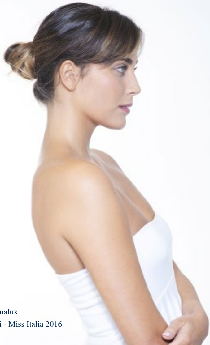
Testimonial Aqualux Rachele Risaliti - Miss Italia 2016