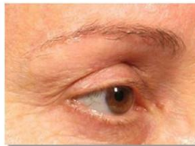
Post-Treatment: 90 Days